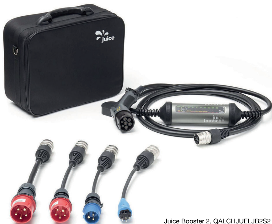
Juice Booster 2, QALCHJUELJB2S2